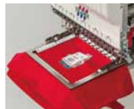
▲Bastidor de Aire