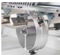
Bastidor Gorras Wide reforzado